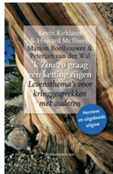
Hervertaling 'Ik Zou zo graag een ketting rijgen'